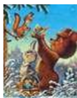
Для самых маленьких

К празднику принято поздравлять и дарить подарки. Как же это делается? Поздравить с праздником можно лично или по телефону. Кроме того, можно послать поздравительную телеграмму или открытку. Перед вами несколько образцов поздравительных открыток к Новому Году: